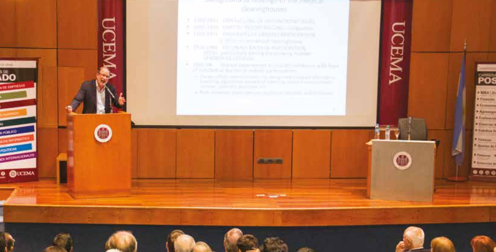
I Profesor Alvin E. Roth (Nobel, 2012) en UCEMA.